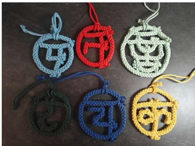
■ 制作者 狗 蛋