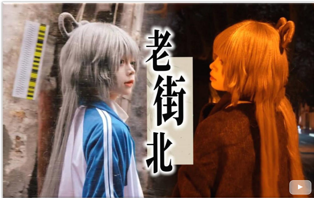
【洛天依 cos】《老街北》/回到童年记忆里的那条老街 BV1wNBaB9Ecg

闹钟 不觉间敲响 让它暂且停下 当沉寂在屋中回荡 推开 床头的玻璃窗 望向 那远方