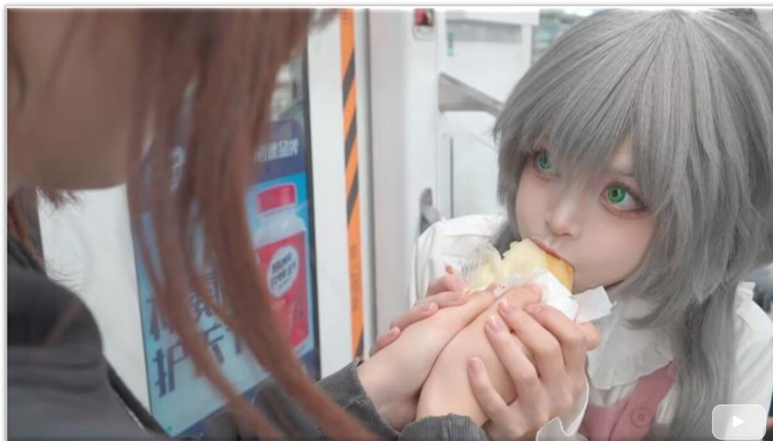
我也特别特别想你！ BV1JnrVBrEf2

让我再相见 那条长街 将泛黄的老胶卷 拨回到十年更前 就道别 逃离浮喧 纵重逢后再道别 或久违的初见